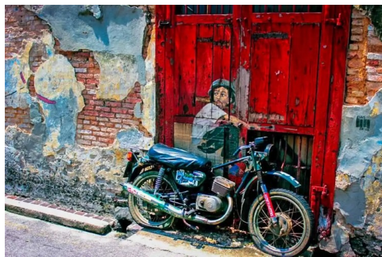
ชม ภาพวาดบนผนัง Penang Street Art ที่โด่งดัง