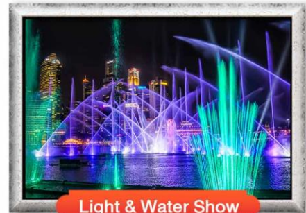
Light & Water Show