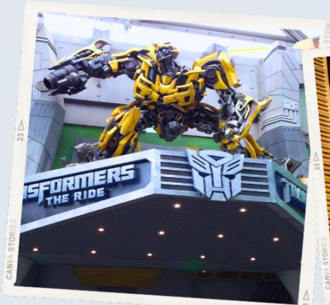
ZONE 1 : HOLLYWOOD