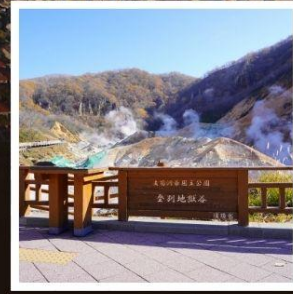
หุบเขานรกจิโกะคุดาบิ