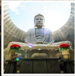
เนินพระพุทธรเจ้า