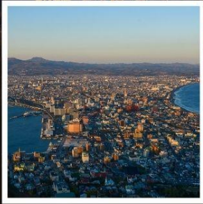
กระเช้าภูเขาฮาโกดาเตะ