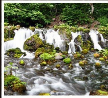
สวนฟูจิตาชิ