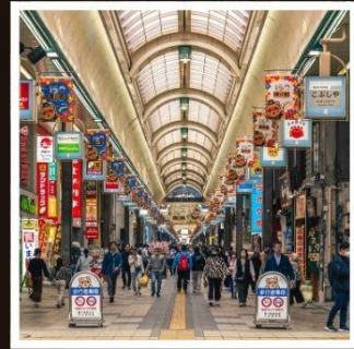
ถนนช้อปปิ้งทานุกิโคจิ

กระเช้าภูเขาฮาโกดาเตะ ชมวิวที่สวยงามที่สุด 1 ใน 3 ของญี่ปุ่น ระดับมิชลิน 3 ดาว Unseen Hokkaido ผลงานสถาปัตยกรรมชิ้นเอก ผสานธรรมชาติอย่างลงตัว “Hill of Buddha” หุบเขานรก จิโกะคุดาบิ ล้อมผืนบรรยากาศของแหล่งกำเนิดออนเซ็นชื่อดังที่สุดแห่งฮอกไกโด ตื่นตากับภูเขาไฟฟูสุ ทิวทัศน์อลังการและธรรมชาติสุดยิ่งใหญ่ ที่พลาดไม่ได้ ชมสวนฟูจิตาชิ 1 ในแหล่งน้ำที่สะอาดที่สุดจากยอดเขาโยเทอิ ถ่ายมุมไหนก็สวยงาม ช้อปปิ้งอย่างเต็มอิ่มจุกอบถนนทานุกิโคจิและมิตซึยะ เอาก้เล็ก พักออนเซ็น 2 คับ!!! ริมทะเล 1 คับ ริมทะเลสาบ 1 คับ อาหารพิเศษ...บุฟเฟ่ต์ซาปู, บุฟเฟ่ต์ซาบู กรุ๊ปสบายๆ เพียง 20 และ 30 ท่านเท่านั้น!!!