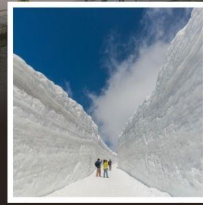
กำแพงหิมะ เจแปนแอลป์