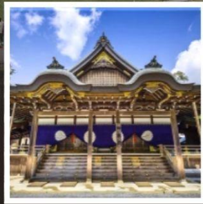
ศาลเจ้าอิเสะ