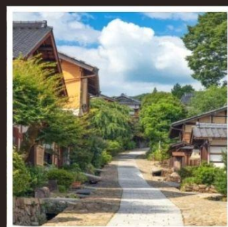
หมู่บ้านโบราณมาโกเมะจุกุ

ชิราคาวาโกะหมู่บ้านมรดกโลก ที่ทุกคนลามาหา เยือน ศาลเจ้าอิเสะ ประตูสู่ดินแดนแห่งจิตวิญญาณ ศาลเจ้าชินโตอันศักดิ์สิทธิ์ที่สุด ขึ้นกระเช้าต่อรถบัส พญากษัตริย์กลางกำแพงหิมะ บนเทือกเขาเจแปนแอลป์ ฮานาโมโมะ โนะ ซาโตะ ดอกท้อกลางหุบเขาที่รอคุณมาเยือน ชมแสงสียามค่ำคั่นกับงานประดับไฟที่ยิ่งใหญ่ที่สุด "นาบานะ โนะ ซาโตะ" ย้อนสู่ยุคเอโดะที่มาโกเมะจุกุ หมู่บ้านที่ผสมผสานธรรมชาติและวัฒนธรรม พักผ่อนชื่นอย่างดี 2 คืน!!! (มีออนเซ็นเบียร์ 1 คืน) อาหารพิเศษ...คูปุโรคะวากิว บุฟเฟ่ต์, อามะ ฟรีเบียร์ทะเลเผา, บุฟเฟ่ต์เบียร์ กรุ๊ปสบายๆ เพียง 30 ท่านเท่านั้น!!!