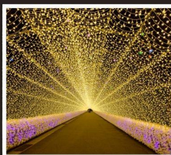
นาบานะ โนะ ซาโตะ