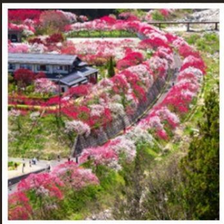
สวนฮานาโมโมะ โนะ ซาโตะ