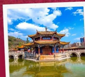
วัดหยวนทอง