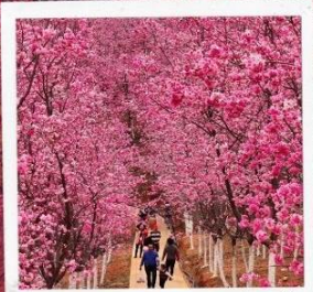
หุบเขาซากุระหมื่นลี