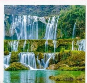
น้ำตกเก้ามังกร