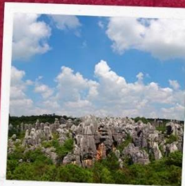
อุทยานป่าหิน